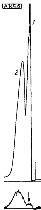
Abb. 6. Pseudogipfel (↓) des inaktiven Lösungsmittels (Äther, 1) neben echtem ^3\text{H} -Gipfel (Toluol- ^3\text{H} , 2). 20 \mu\text{l} Äther, 20 \mu\text{l} Toluol- ^3\text{H}

ders praktische Radiogaschromatographie mittels Durchfluß-Ionisationskammer. Bei Vorhandensein eines Flüssigkeits-Szintillations Spektrometers ist eine Kontrolle leicht möglich, indem der Gasaustritt der Durchfluß-Ionisationskammer über eine Teflon-Schlauchverbindung bei Beginn der gaschromatographischen und Ionisationskammer-Gipfel in Flüssigkeits-Szintillations-Fläschchen mit Toluol oder Toluol/Äthanol usw. (je nach den Löslichkeitseigenschaften der erwarteten Fraktionen) plus organischem Szintillator getaucht wird. Die Fläschchen stehen in Bohrungen in einem Plexiglas-Block, der einfach unter dem starr befestigten Teflonschlauch entlang geschoben wird. Man kann so innerhalb von Minuten feststellen, ob es sich bei den Gipfeln um echte oder um Pseudopeaks handelt. Diese Methode ist billiger als die Anschaffung des Zusatzgerätes (Abb. 1) mit Anthracenröhrchen (Packard TRI CARB Gas Fraction Collector, model 830) und gestattet